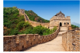
Mynd 4.1: Kínamúrinn

Kínamúrinn er u.þ.b. 21.196 8 kílómetra langur virkisveggur í Kína. Núverandi Kínamúr var að mestu byggður á tímum Ming-keisaraveldisins, en Ming-ættin ríkti í Kína á tímabilinu 1368–1644. Hann var reistur til þess að vernda Kína gegn innrásum mongólskra og tyrkneskra ættflokka úr norðri og norðvestri. Þegar mest var stóðu rúmlega ein milljón hermanna vörð á múrnum. Kínamúrinn, sem er á heimsminjaskrá UNESCO, er vinsæll ferðamannastaður í Kína og eitt þekktasta mannvirki landsins.